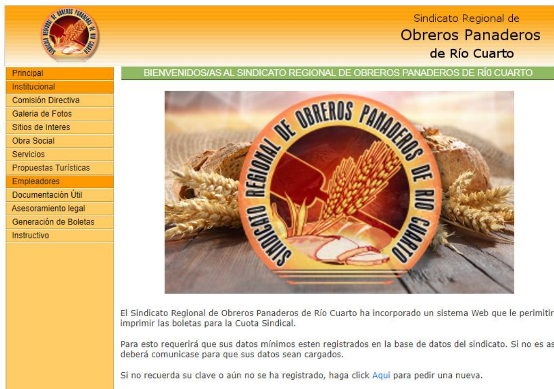
Figura 1. Página principal del Sindicato